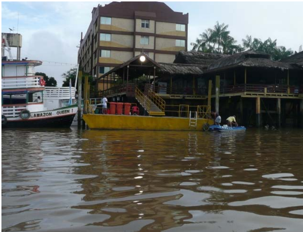
Dinghy dock de l'hôtel Beira Rio

Les quelques plaisanciers qui s'y retrouvent peuvent aussi s'arranger entre eux pour gardiennier alternativement les bateaux