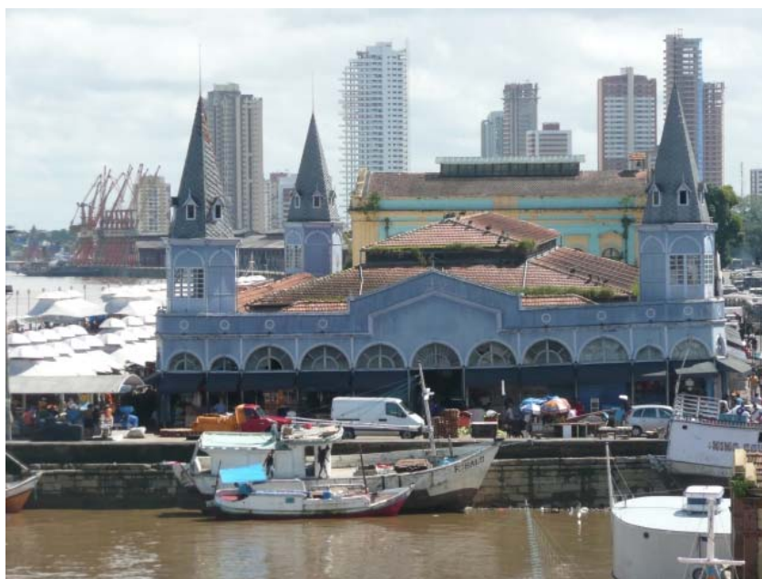
Marché Ver O Peso

Les restos de l'Estacion das docas sont sympas (micro brasserie)