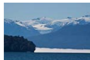
Profitant du beau temps, Fleur de Sel nous emmène du côté de Puyuguapi , au pied des Andes.