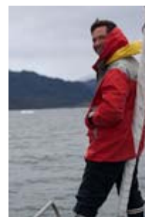
Nouveaux détours glaciaires, mais par temps maussade, dans les Estéros Amalia & Asia .