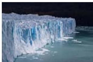
En bus toujours, excursion en Argentine pour voir l'extraordinaire glacier géant Perito Moreno .