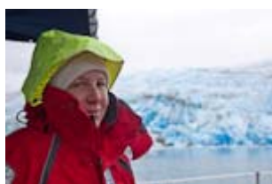
Dernier détour vers un glacier, mais ce sera l'un des plus beaux et bleutés, dans le Seno Iceberg , avant d'attendre quelques jours pour passer le Golfo de Penas.