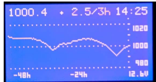
Le baro porte ici la trace du passage de deux fronts froids successifs, reconnaissables leurs creux en V, et indique qu'à 14h25 UTC, la pression est de 1000.4 hPa, et qu'elle a augmenté de 2.5 hPa en 3h

Les inégalités de pression à la surface de la Terre (on appelle cela le gradient de pression) sont la cause première du vent, et la lecture de la pression permet d'en savoir plus sur le temps qu'il fait et qu'il fera. Dans les régions extratropicales, le vent est principalement régi par l'interaction entre zones cycloniques (de basses pressions, en français dépression , en anglais low ) et zones anticycloniques (de hautes pressions, en français anticyclone , en anglais high ). Les dépressions sont accompagnées de fronts, zones plus ventées (et pluvieuses !), et qui sont caractérisés par des pressions plus faibles, tandis que les anticyclones projettent des dorsales, où le vent est très faible, et que l'on reconnaît à leur pression plus élevée.