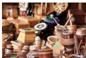
Visite de Castro , la capitale de la grande île de Chiloé, de sa voisine Dalcahue où se tient un marché artisanal, et de leurs églises.