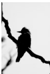
De nombreux oiseaux et de beaux paysages nous entourent dans les environs du Canal Wide .