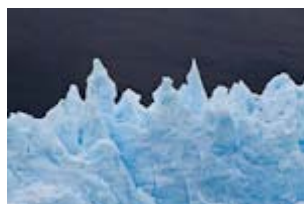
Le glacier Pío XI , le plus grand des glaciers maritimes de Patagonie, un véritable géant de glace, nous accueille à ses pieds le temps d'une journée. On se sent tout petits !