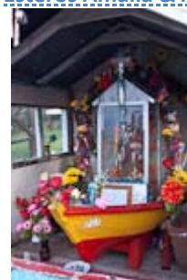
Parmi les oiseaux, nous remontons le Paso del Indio pour arriver à Puerto Edén .