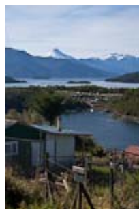
Après le Golfo de Penas, nous traversons l' archipel des Chonos , pour arriver à Puerto Aguirre .