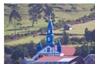
Nous poursuivons le tour des églises en bois, en sillonnant le NE de l'archipel de Chiloé .

Enfin, mention spéciale pour quelques vues panoramiques et quelques animations (nécessitent Quicktime) :