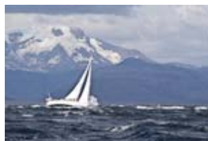
Lutte contre le vent et la mer, pour ressortir du Seno Unión , avant d'étaler notre plus grosse tempête.