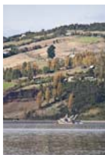
Arrivée à Chiloé , et découverte des petites églises du SE de l'archipel.